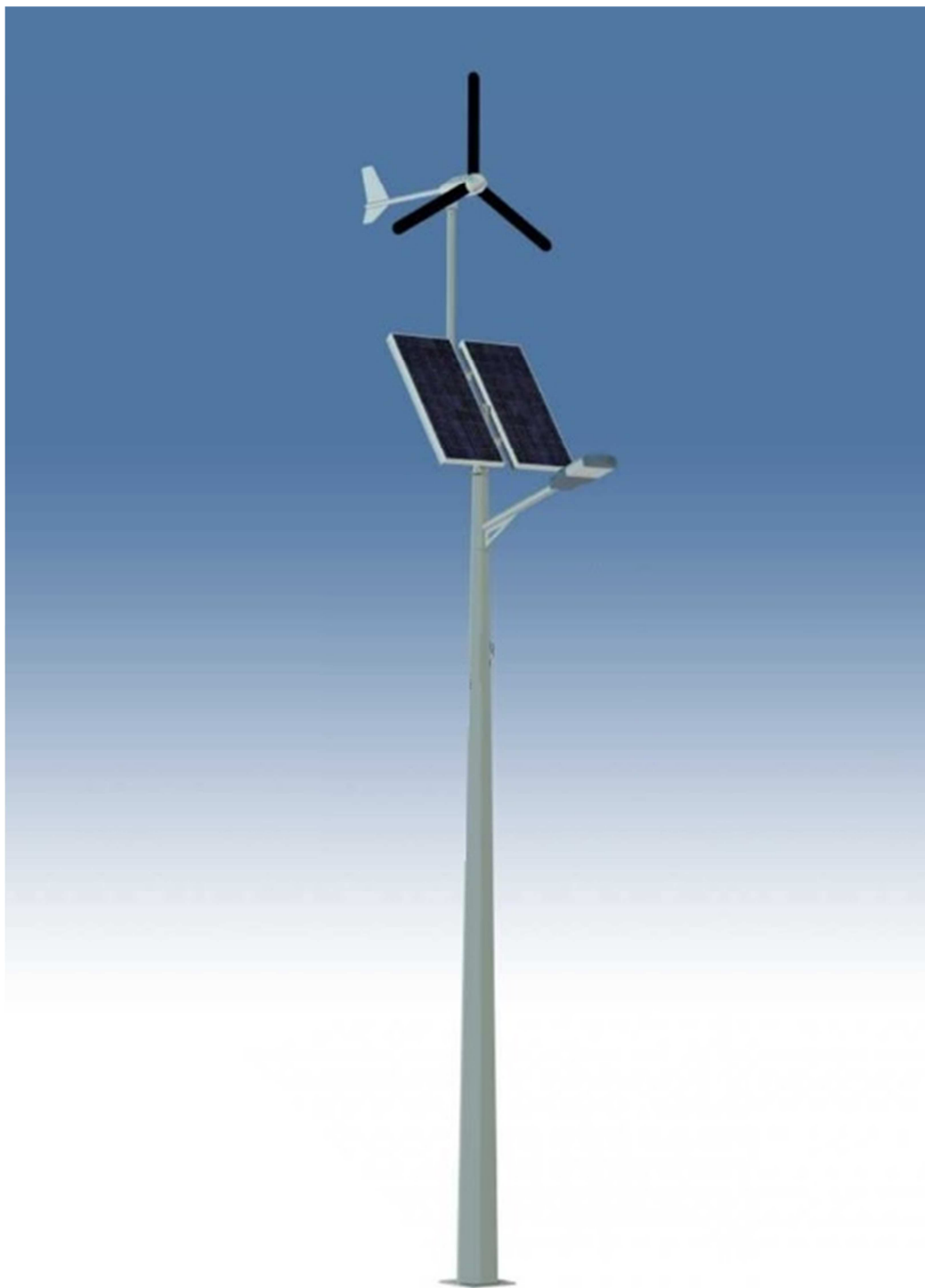
Fot. 1 Latarnia solarno – wiatrowa